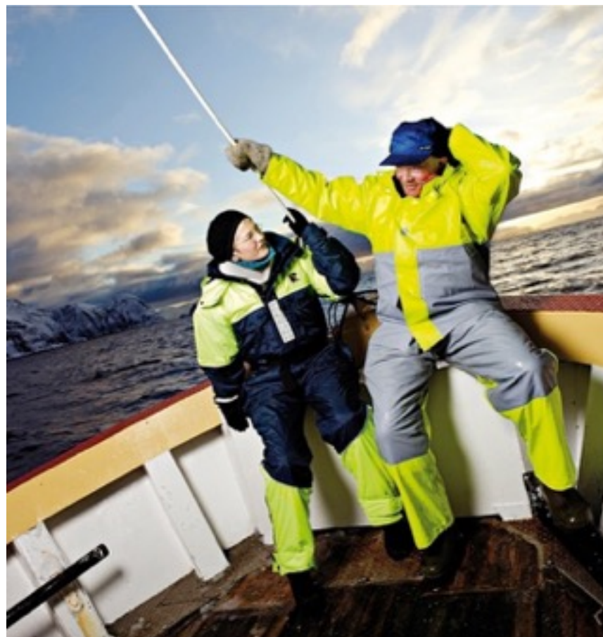
Regatta Fisherman - utviklet i samarbeid med SINTEF

Egen forskningsgruppe som arbeider med helse, miljø og sikkerhet i fiskeri - og havbruksnæringen